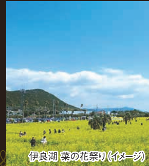
伊良湖 菜の花祭り(イメージ)