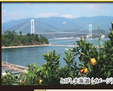
とびしま海道(イメージ)