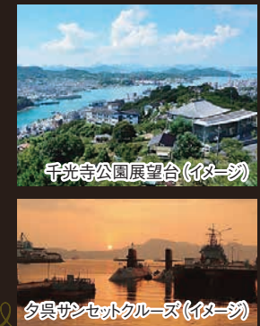
千光寺公園展望台(イメージ)