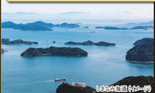
しまなみ海道(イメージ)