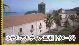
ホテルアルティア鳥羽(イメージ)