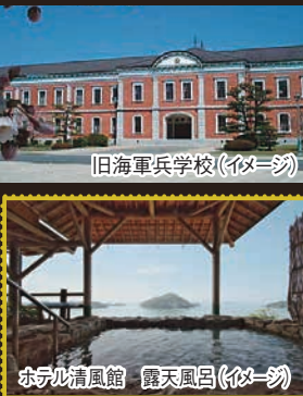
旧海軍兵学校(イメージ)