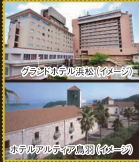
グランドホテル浜松(イメージ)