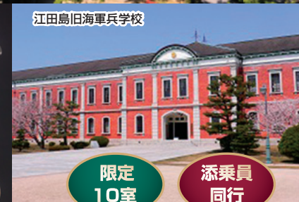
江田島旧海軍兵学校