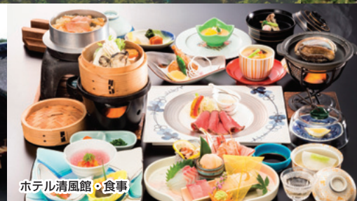
ホテル清風館・食事