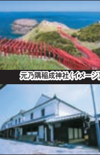
元乃隅稲成神社(イメージ)