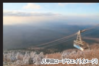
八甲田ロープウェイ(イメージ)