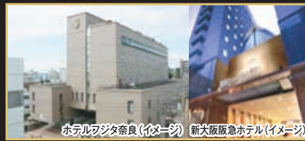
ホテルフジタ奈良(イメージ) 新大阪阪急ホテル(イメージ)