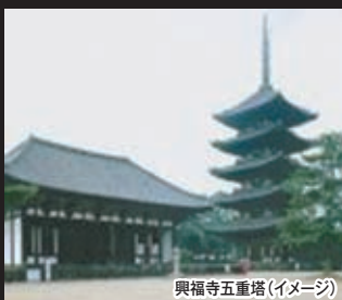
興福寺五重塔(イメージ)