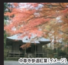
中尊寺参道紅葉(イメージ)