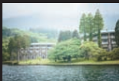
ザ・プリンス箱根芦ノ湖(イメージ)