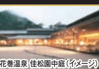
花巻温泉「佳松園」中庭(イメージ)