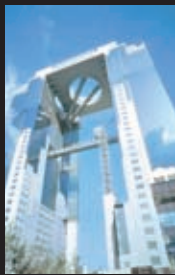
梅田スカイビル(イメージ)