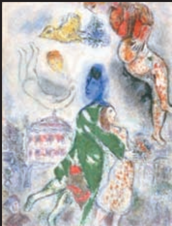
マルク・シャガール《オペラ座の人々》

1968-1971年 油彩/カンヴァス ポーラ美術館蔵 © ADAGP, Paris & JASPAR, Tokyo, 2016, Chagall® E2442