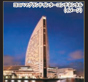
ヨコハマグランドインターコンチネンタル(イメージ)