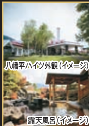
八幡平ハイツ外観(イメージ)