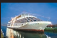
マリニャール(イメージ)