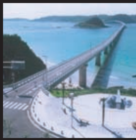
角島大橋(イメージ)