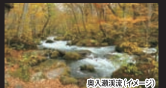
奥入瀬溪流(イメージ)