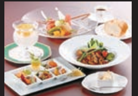
ホテル西長門リゾートの朝食(イメージ)