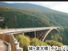
城ヶ倉大橋(イメージ)