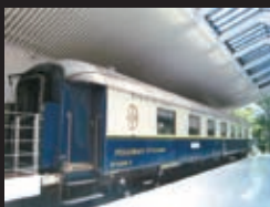
箱根ラリック美術館、オリエンタル(イメージ)

1968-1971年 油彩/カンヴァス ポーラ美術館蔵 © ADAGP, Paris & JASPAR, Tokyo, 2016, Chagall® E2442