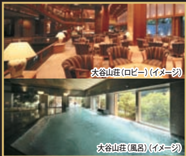
大谷山荘(ロビー)(イメージ)