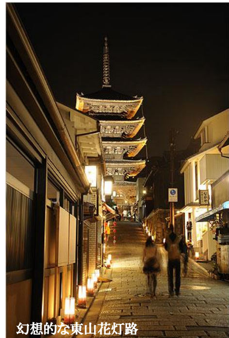
幻想的な東山花灯路